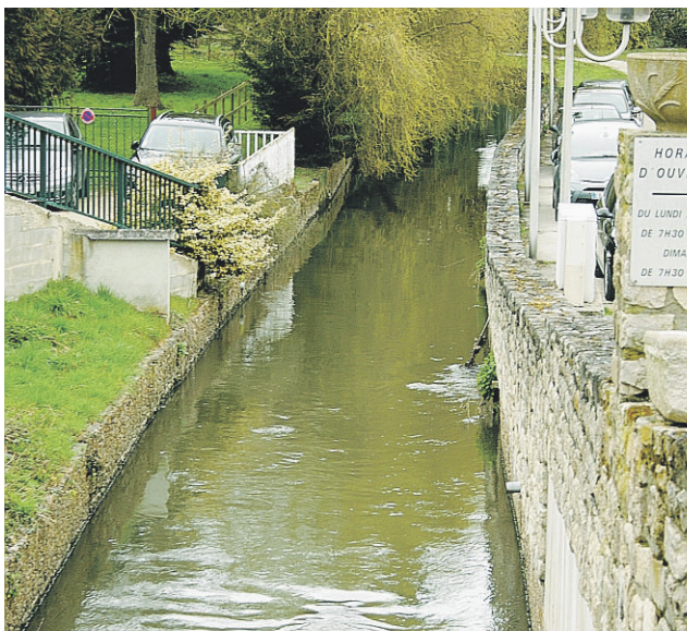
La Beuvronne traverse Mitry, Villeparisis, Claye-Souilly, Annet et Fresnes. Elle se déverse ensuite dans la Marne.